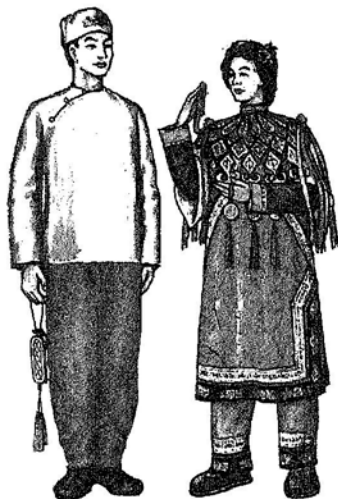
Дунгане. Традиционная одежда.

Муж. и жен. верхняя одежда — кафтан из сукна, расшитый бисером; по покрою и внешнему виду сходна с эвенкийской. Муж. рубахи и штаны и жен. платья шились из покупных тканей и не отличались от одежды рус. старожилы центр. Таймыра. Зимой Д. носили парки из оленьего меха, по покрою напоминавшие нганасанские, только более длинные, или сокуи из того же материала ненецкого образца. Летом — те же сокуи, но сшитые из сукна. Головные уборы муж. и жен. в форме капора из сукна, расшитого бисером (летние), или лисьих камусов (зимние). Обувь из