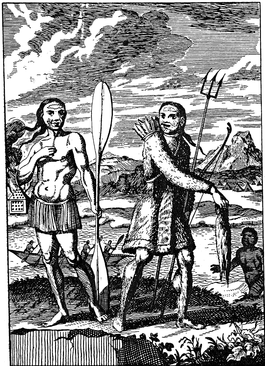
Пешие тунгусы на Ангаре.

жизни отразился и на костюме, который должен был быть легким, не стесняющим движений и быстро просыхающим. Поэтому он был составным (кафтан с нагрудником, покрывающим грудь, натазники с ногами-