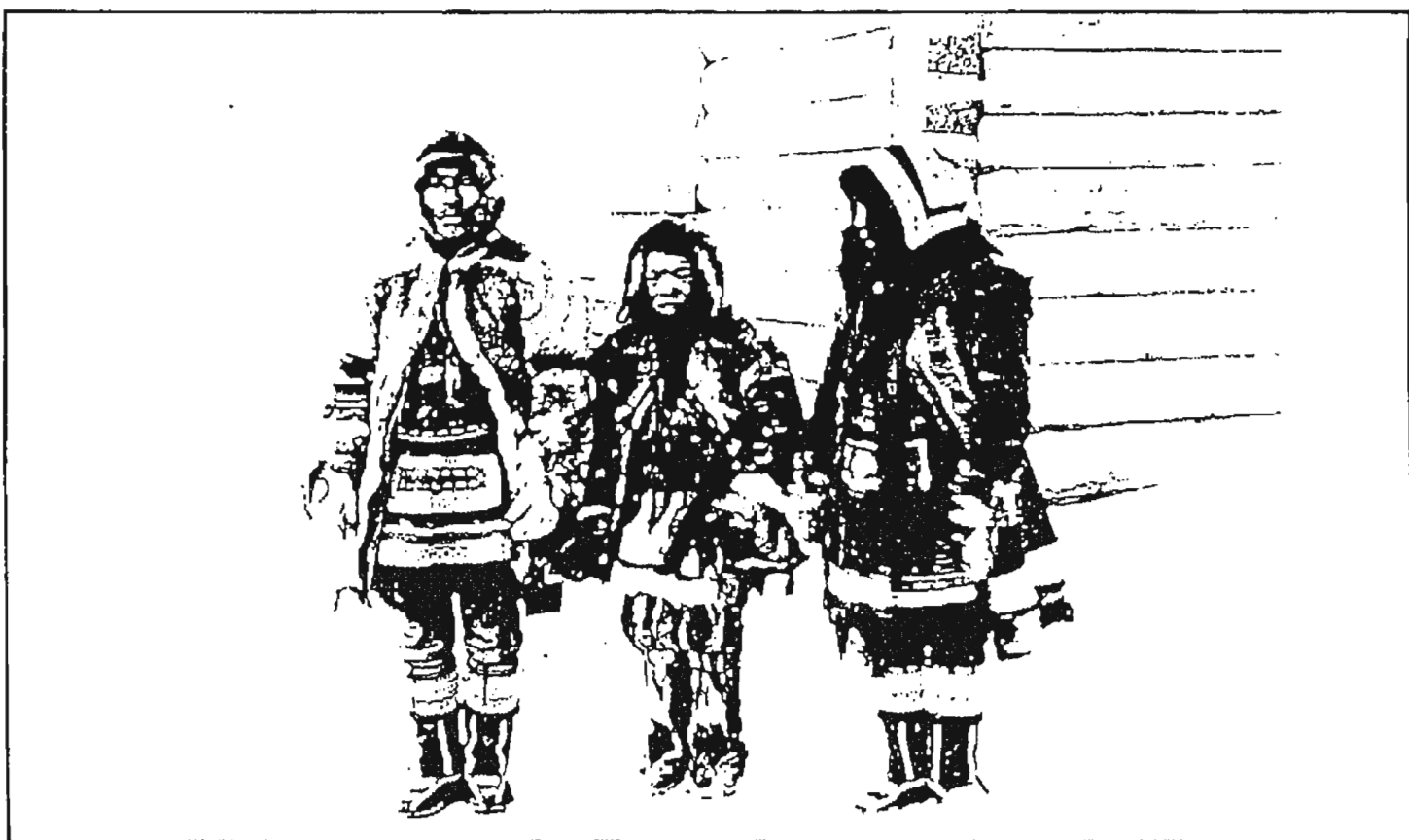
Юкагиры в национальной одежде