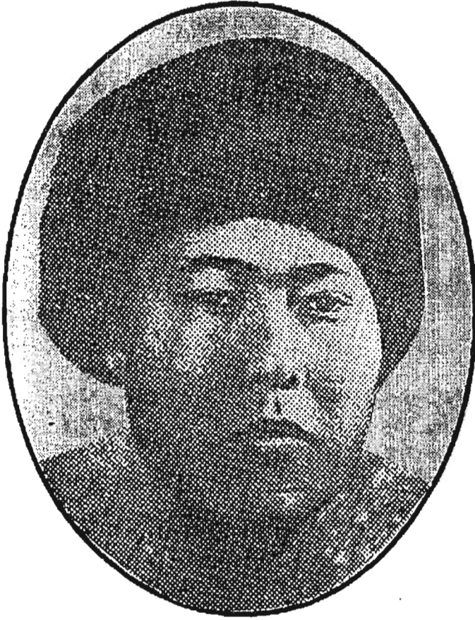
Н.И.Спиридонов (Тэки Одулок)