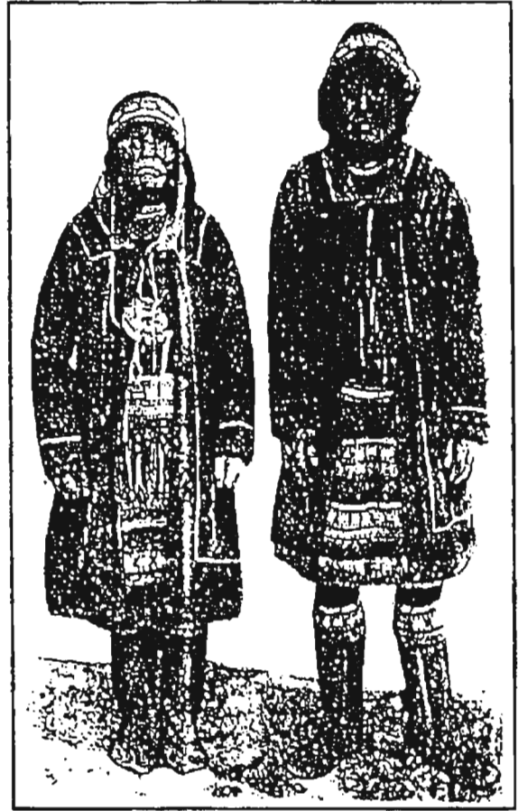
Женская и мужская одежда юкагиров