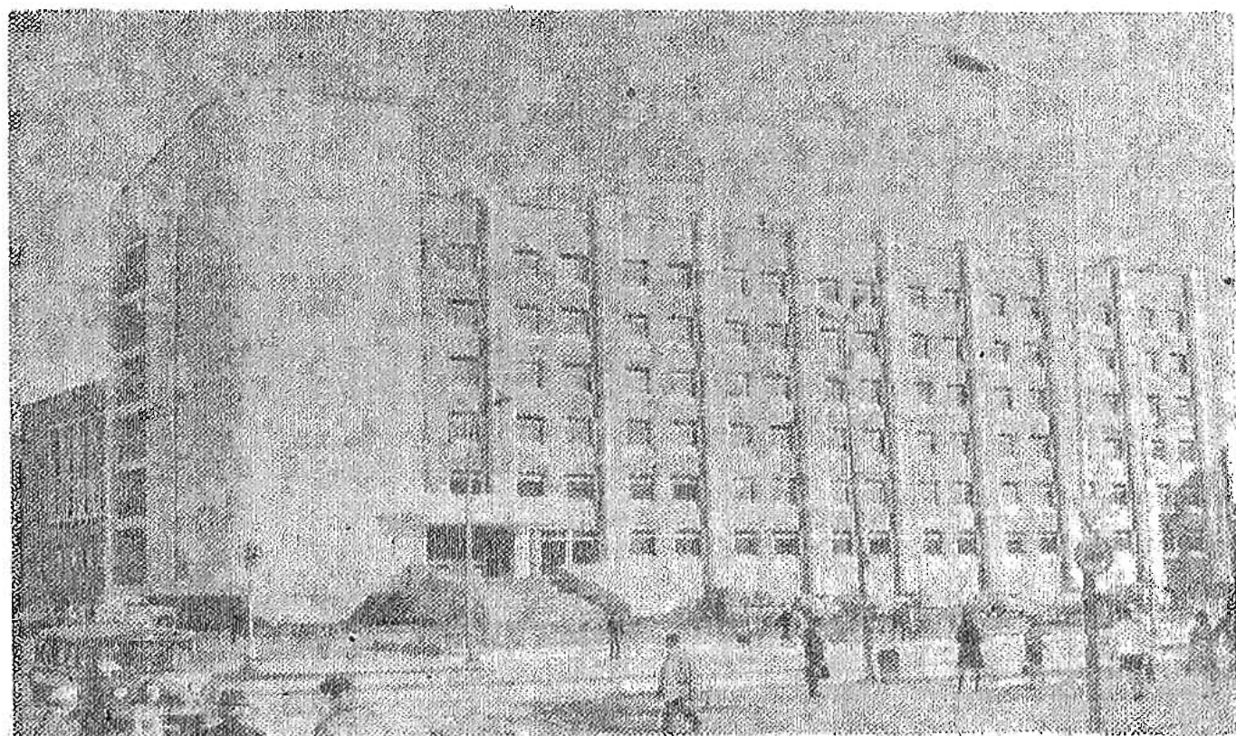
Здание Якутского горкома КПСС и горисполкома.

Служебные кабинеты расположились вдоль проспекта Ленина, а конференц-зал со столовой расположены в отдельном объеме вдоль улицы Курашова. Такое рас-