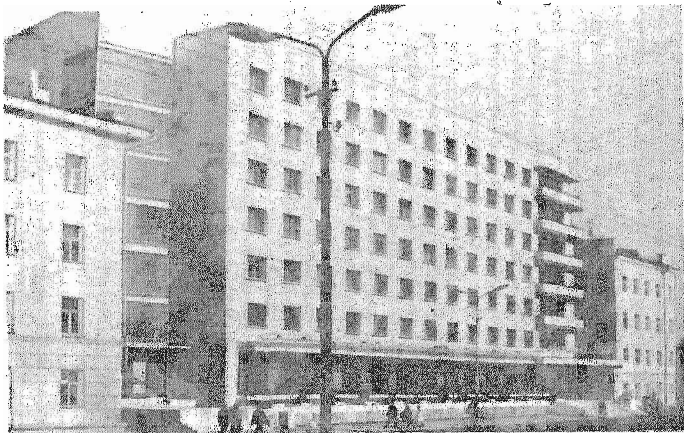
Гостиница «Лена». II очередь

члененное решение, в отличие от компактного в здании Совета Министров, предоставило автору увеличить этажность до шести и тем самым была заложена первоначальная основа пространственной композиции проспекта Ленина — главной магистрали города.