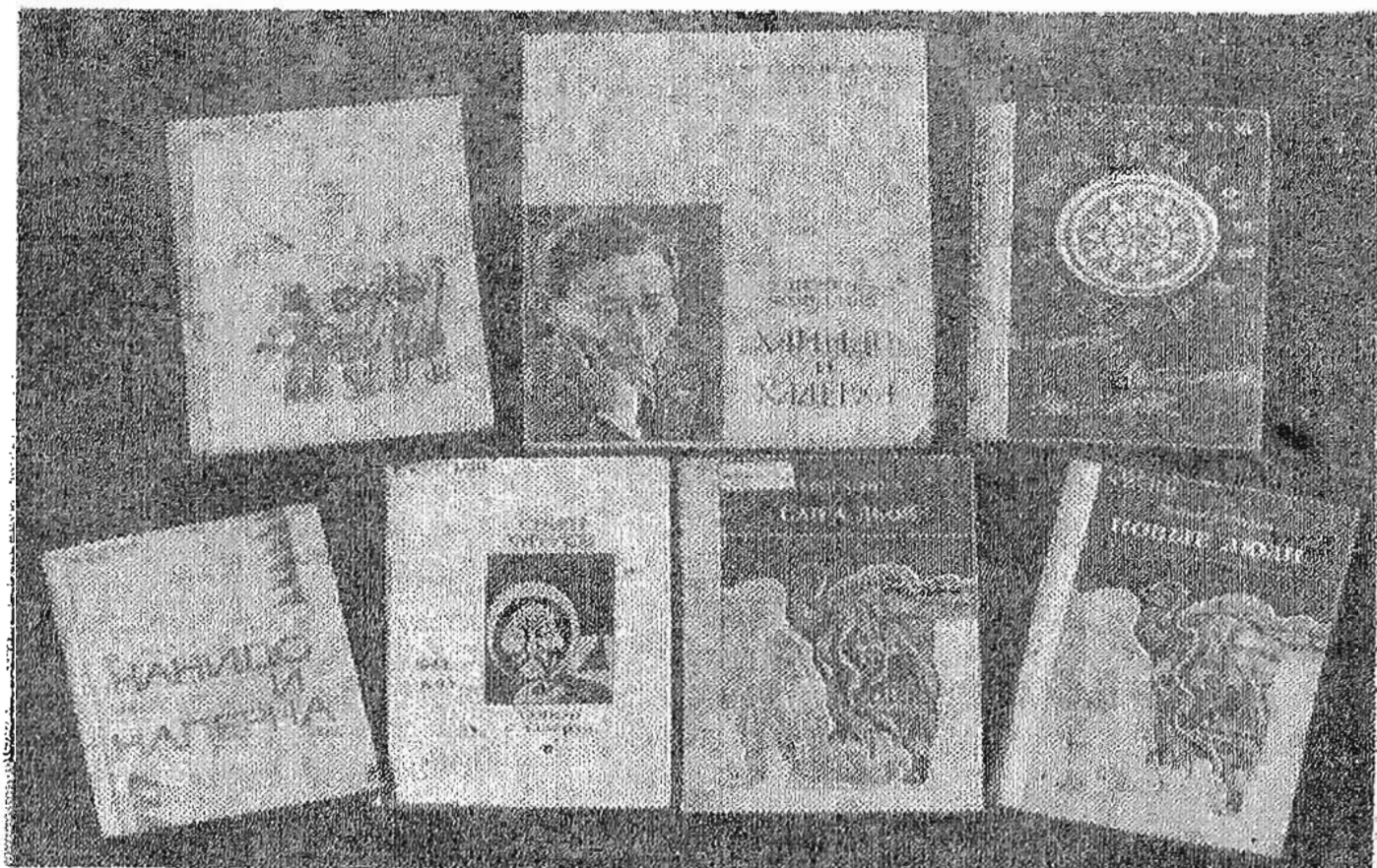
Книги Семена Курилова, изданные в Москве и Якутске

Прелесть романов С. Курилова состоит в том, что писатель приобщается к совсем незнакомой ему жизни и в то же время весьма интересной для него. Вот одни