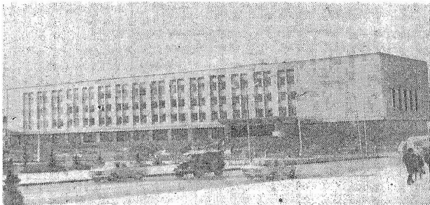
Здание Верховного Совета и Совета Министров Якутской АССР

объемного проектирования, он активно взялся за проектирование отдельных зданий и сооружений г. Якутска. Хорошая профессиональная подготовка, вдумчивое, любознательное сотрудничество с специалистами со смежными специальностями снискали ему авторитет среди сотрудников института.