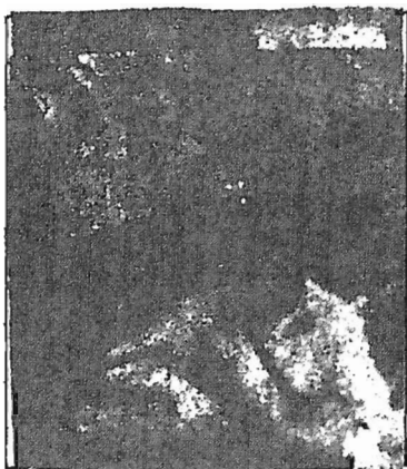
Тэки Одулок среди друзей во время охоты.